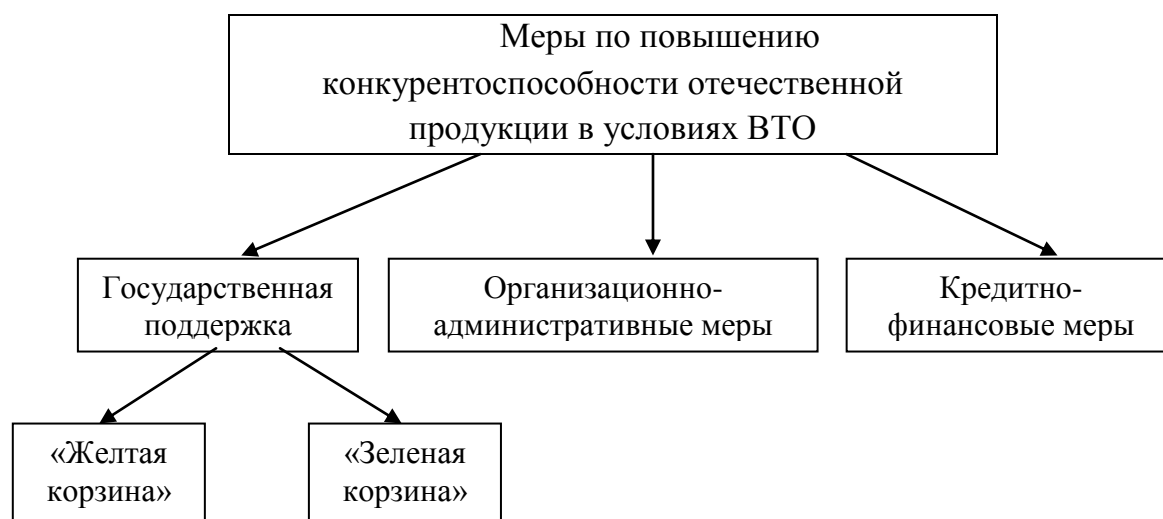
Рисунок 3 – Комплекс мероприятий по повышению конкурентоспособности отечественного АПК

Выводы и предложения. Резюмируя вышеизложенное, мы предлагаем следующий комплекс мероприятий по повышению конкурентоспособности отечественного АПК (рис. 3).